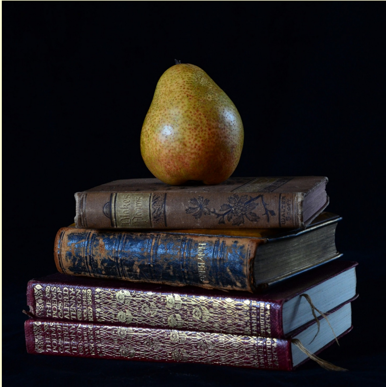
Old books and a pear – JAN