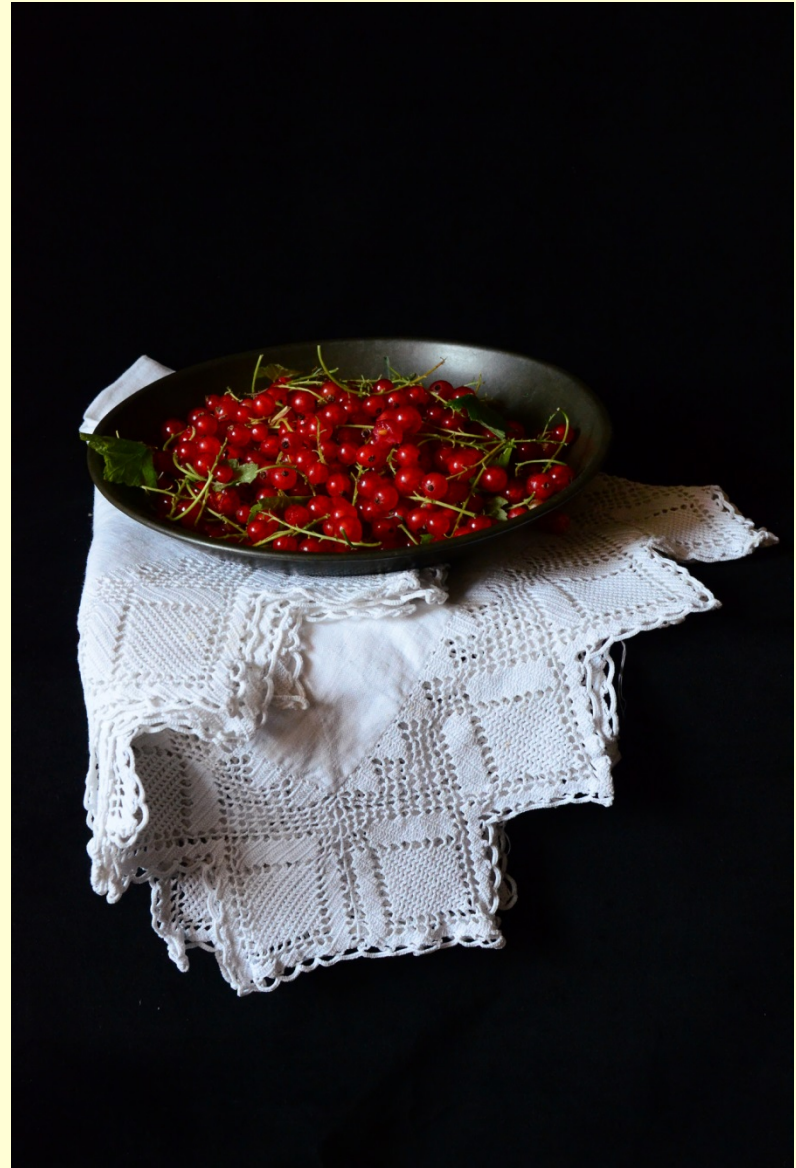
JAN Red currants and lace cloth