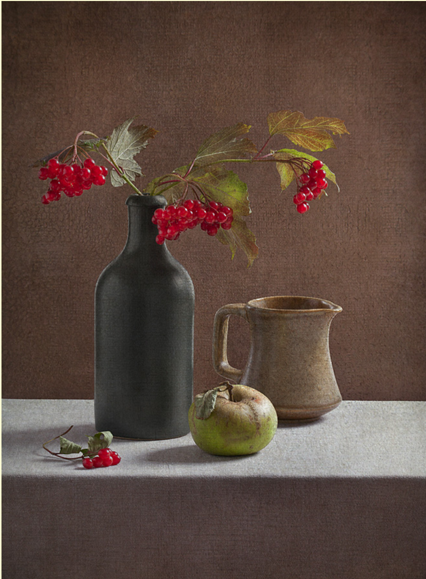
Inna Karpova Still life with apple