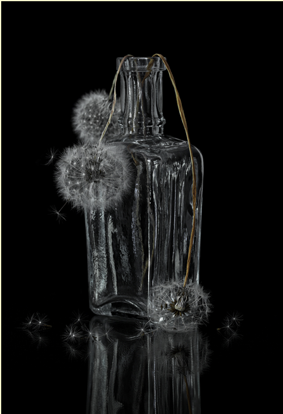
On black Inna Karpova