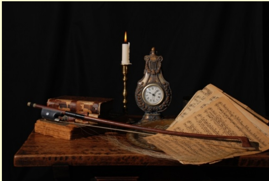
Flemish still life with sheet music