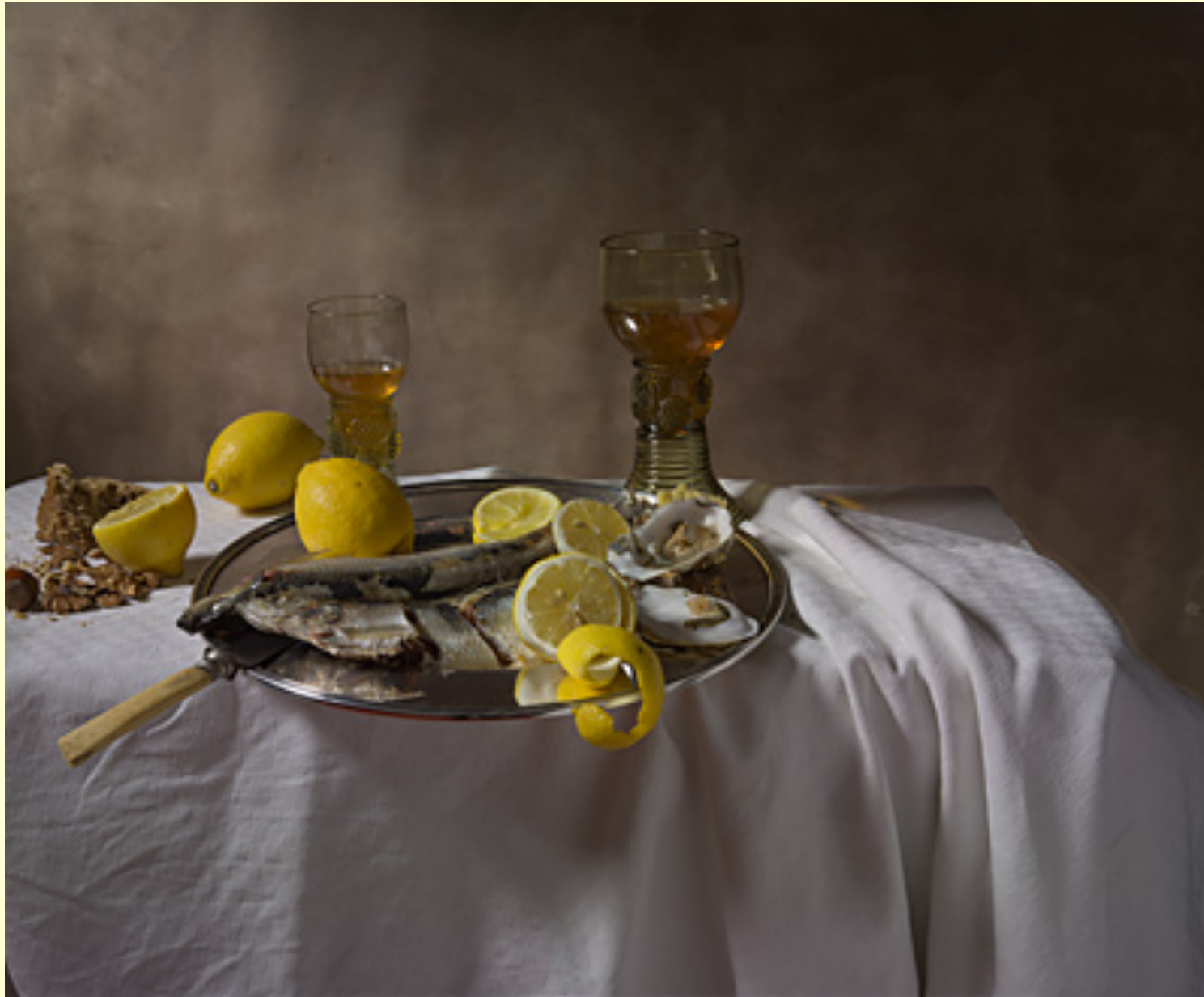
Pieter CLAESZ 1597/98 - 1660