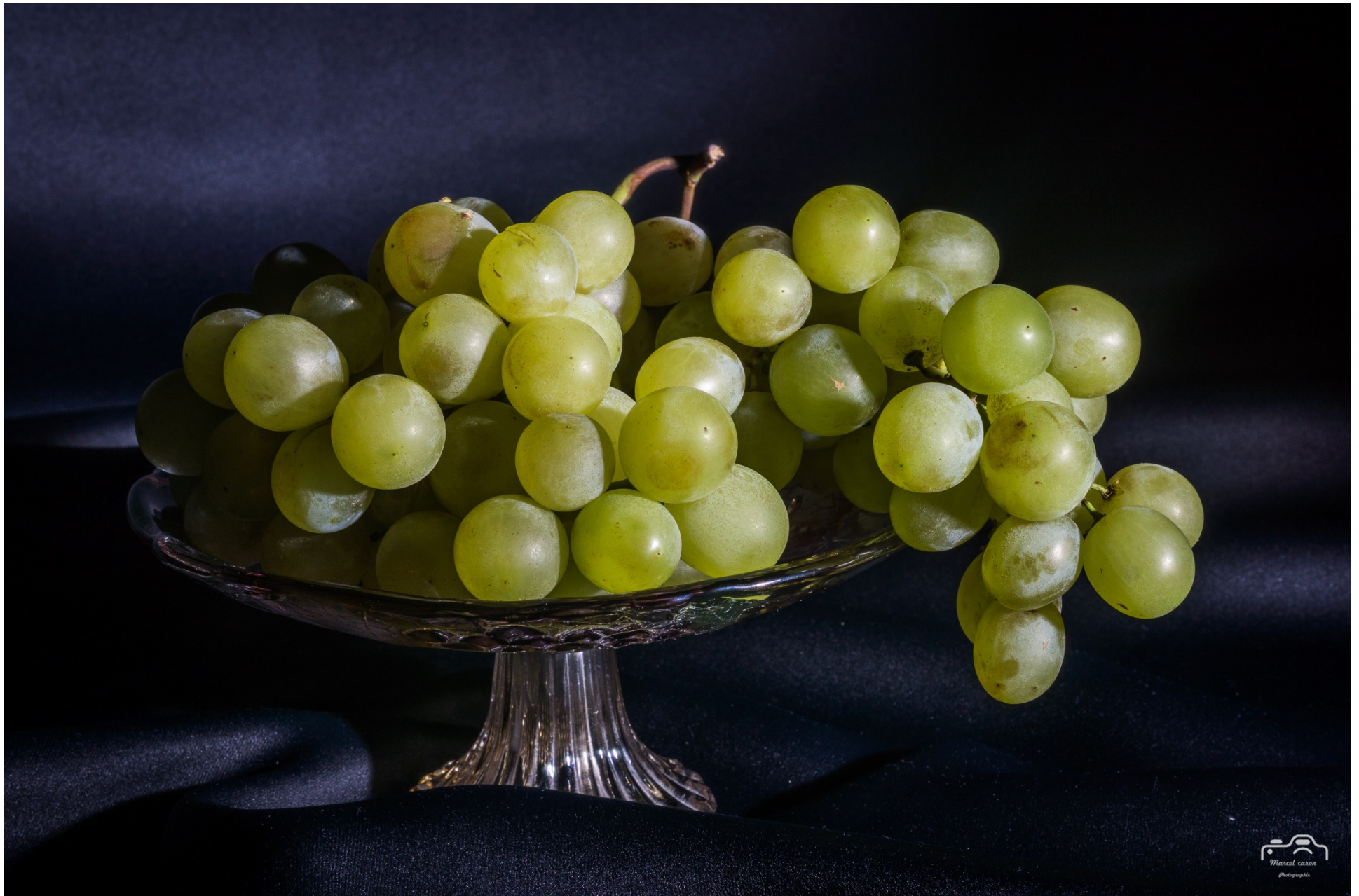
Marcel Caron Nature morte au raisin 35