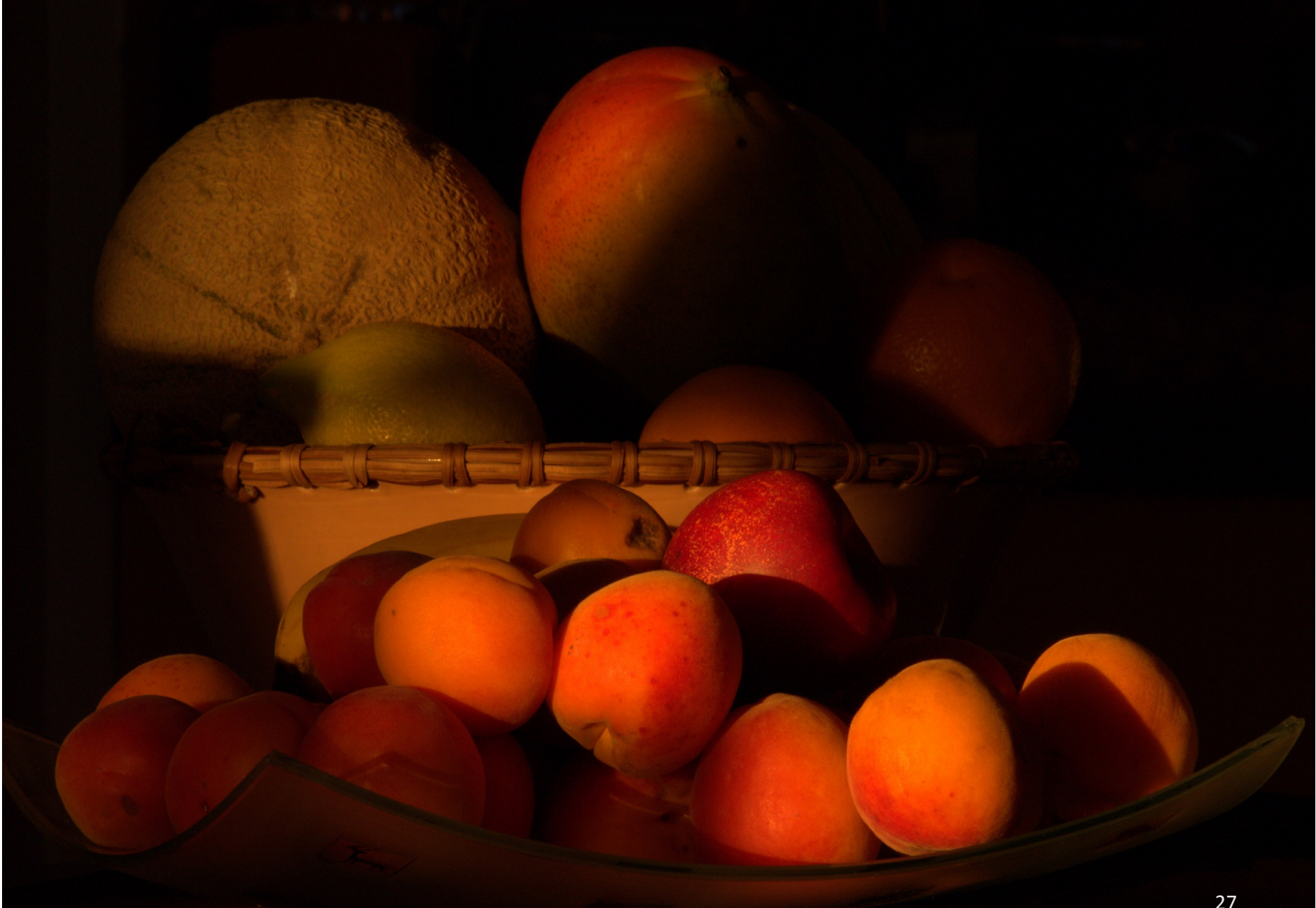
Gregory Decoster Fruits gorgés de lumière