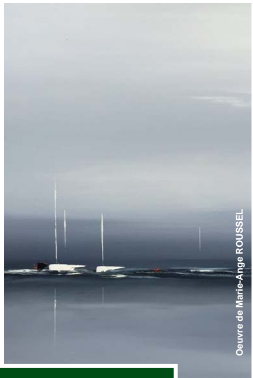
Oeuvre de Marie-Arge ROUSSEL