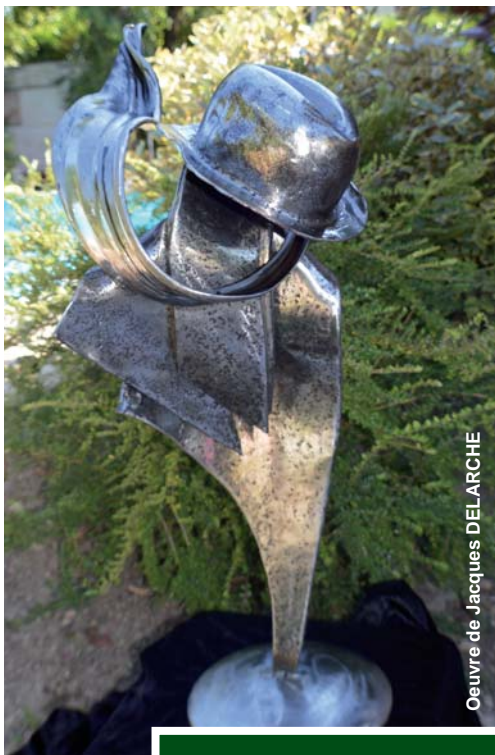
Oeuvre de Jacques DELARCHE